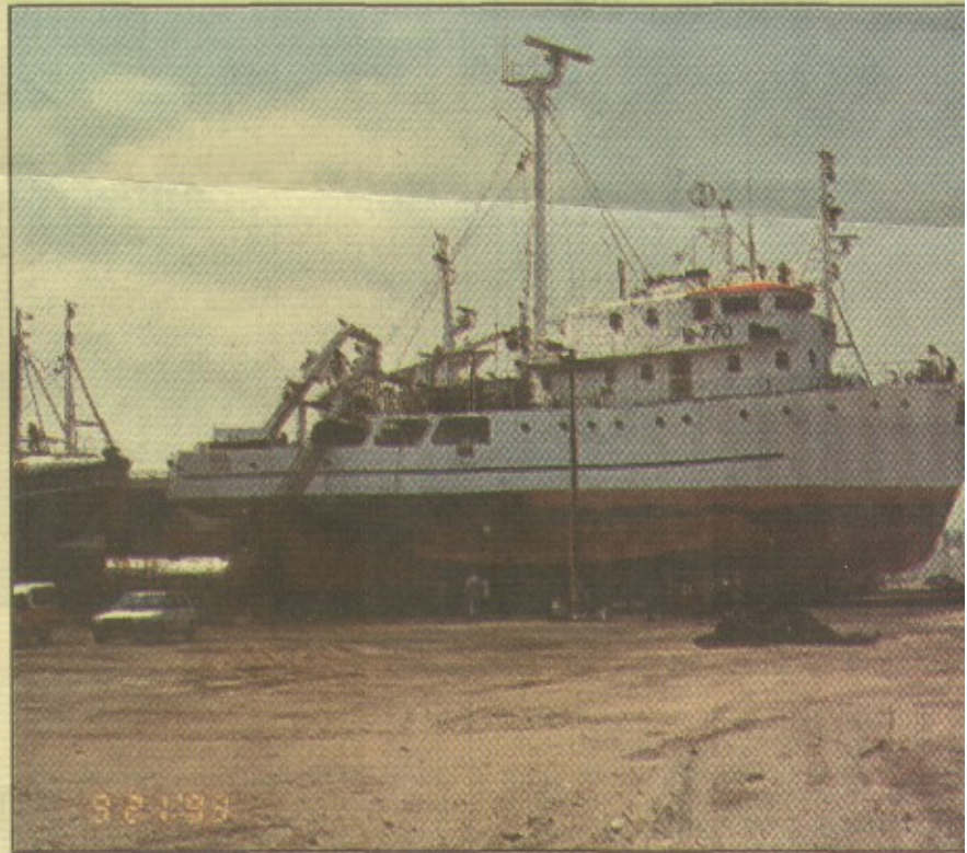
Sidas (Fiskeriverkets) forskningsfartyg Goa på 36 meter och med mellan 25 och 30 mans besättning/forskare är fullt modernt. Här ligger det på redan.